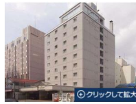
ホテルクレール札幌

グローバルエージェンツ（本社：渋谷区）は2016年10月、札幌市にあるホテルクレール札幌を取得した。同社は首都圏を中心に、入居者同士の交流スペースを設けたソーシャルアパートメントと呼ぶ賃貸住宅の事業などを手がけている。ホテル事業は、東京と沖縄に続き3棟目となる。売り主はアズ企画設計（本社：埼玉県川口市）だ。