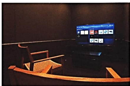
60インチの大型TVとYAMAHA製の大型スピーカーが完備されたシアタールーム。Blu-ray対応のDVDプレイヤーは4Kにも対応。最高画素の映像を大迫力で楽しめる。ルームメイトと映画鑑賞を楽しむ入居者もいる

せるのなら……と、『OTOWA神戸元町』に入居を決めたんです。現在は商社に勤めるかたわら4つのバンドを掛け持ちし、休日には併設の防音スタジオで楽器の練習に打ち込んでいるという。 「練習の後にラウンジでなごんでいると、『キーボードやっつるなら、ちょっと弾いてよ』と声をかけられ、音楽好きの住人と自然にセッションするようになりました。ちょうどその頃、OTOWA内でイベントが開催されたんです」