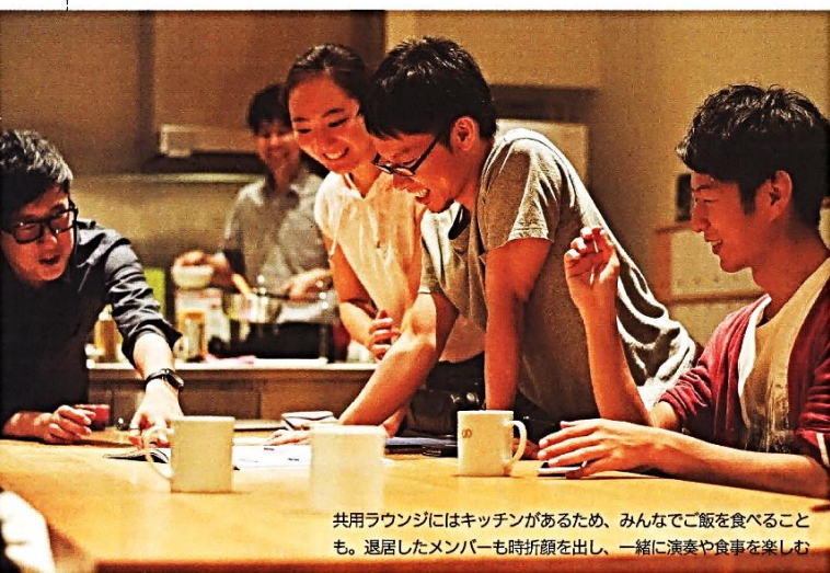
共用ラウンジにはキッチンがあるため、みんなでご飯を食べることも。退居したメンバーも時折顔をだし、一緒に演奏や食事を楽しむ