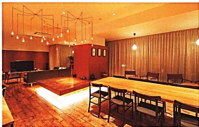
約80㎡の大きな共用ラウンジ。木の質感を生かした内装で、ほっと安らげる空間。ソファでくつろぎながらテレビを見るもよし、仕事をするもよし。思い思いの時間を楽しめる場所だ。物件内で結成されたバンドのライブもここで行われる