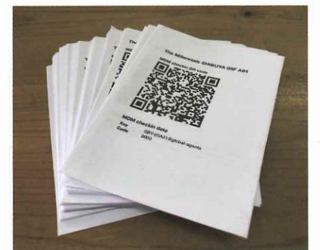
130台iPod touchを1台ずつ客室に紐付けるため、初期設定をQRコードを読み込むことで自動で行えるよう開発。手入力で2～3日かかっていた初期設定が、1日かからず完了した。

化する「初期設定カード」が作られた。各客室にはIPアドレスが割り当てられており、iPod touchは1台ずつ個別のIPアドレスにつながっている。リモコンとなるiPod touchは、該当するIPアドレスの客室に正しくコマンドを送らなければならない。しかし、120台すべてのデバイスに、IPアドレスを1台ずつ手入力するのは大変な作業だ。そこで、IPアドレスと部屋番号を自動で割り振るためのQRコードを作成。紙に印刷したQRコードをiPod touchで読み込むだけで、それらの初期設定が完了するよ