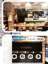
▷ カフェ WORLD NEIGHBORS CAFE 清澄白河

スウェーデン製の洗濯機を備えたランドリーカフェ。ポークソーサー、オレンジ、チェダーチーズを挟んだWNCサンドイッチ1296円をはじめとするオリジナルのホットサンドは、ハイビスカスソー 540円など自家製ドリンクと相性抜群。全商品テイクアウトOKなので、目の前の木場公園で味わって。