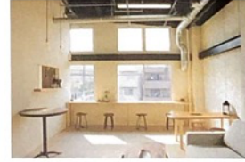
▷ ギャラリー・カフェ EARTH+GALLERY

アートやデザイン、カルチャーなど平面立体問わず現代アートを紹介するギャラリー。今春2階にカフェ・パームもオープンし、約30種のスパイスで作るオリジナルスパイスチキンカレー 850円や、木場公園で楽しめるサンドイッチとワイン付きピクニックセット2600円などを提供する。