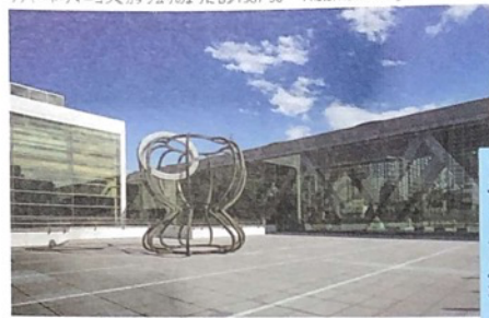
リチャード・ディーコン・カタツムリのように▷1987-96