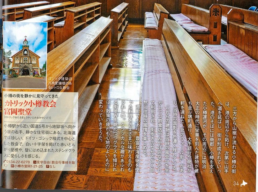
クラシカルな空間の教会

礼拝堂の大きさにあるステンドグラスからは、やわらかな光が差し込む。建築当初からある古いもので、中には現在では作られていない色ガラスも使われている