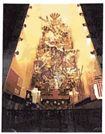
※写真は過去の様子