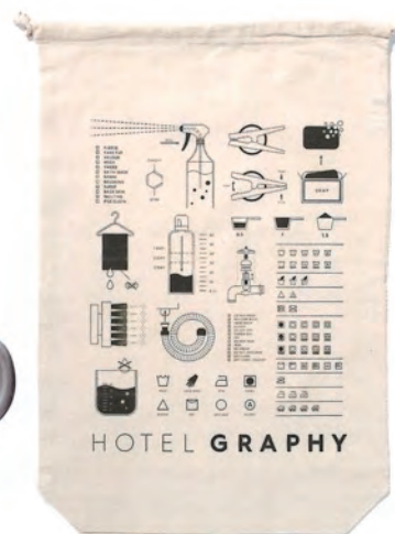
ランドリーバッグ