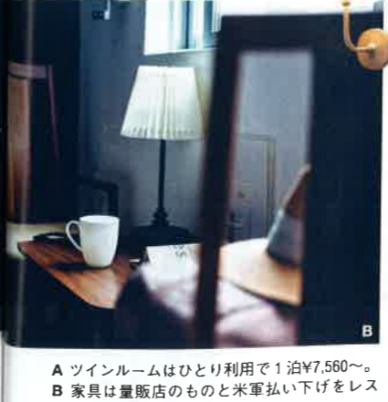
A ツインルームはひとり利用で1泊¥7,560~。B 家具は量販店のものと米軍払い下げをレストアしたものをミックスしている。

④那覇市安里1-2-6 ☎098-894-8960 IN13時 OUT10時 ④1室(個室) ¥4,320~(税・サービス料込み) ④7 (ドミトリー含む) ④可 ④ゆいレール牧志駅から徒歩約3分 map>>③-F-1