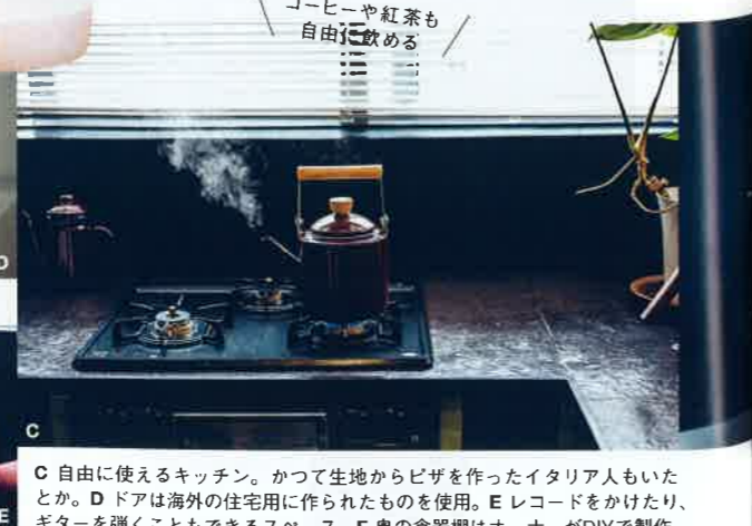
C 自由に使えるキッチン。かつて生地からピザを作ったイタリア人もいたとか。D ドアは海外の住宅用に作られたものを使用。E レコードをかけたり、ギターを弾くこともできるスペース。F 奥の食器棚はオーナーがDIYで製作。

那覇・安里 The LANAI HOSTEL ラナイホステル 喧騒から離れ、落ち着いた時を過ごす