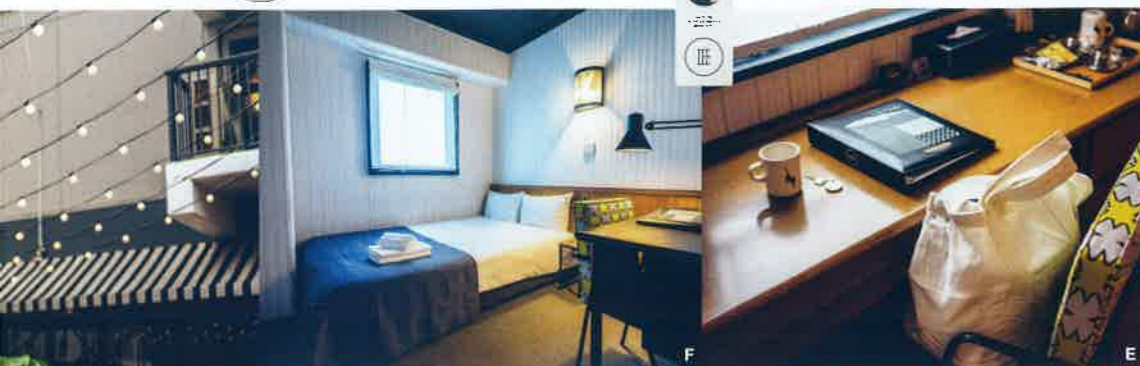
A 宿泊者だけでなく、多様な人が訪れるラウンジ。B モーニングメニューのひとつ。(ドームパンケーキプレート) ¥1,000 C ハンガーもオリジナルのこだわり。D デラックスルールの湯船は、縦型の造りがユニーク。E 館内のチェアやソファのほとんどにオリジナルのファブリックが使われている。F スタンダードダブルルーム。数種類が使い分けられた壁紙にも注目したい。G 悪天候の日を除き、テラスではBBQが一年中楽しめる。