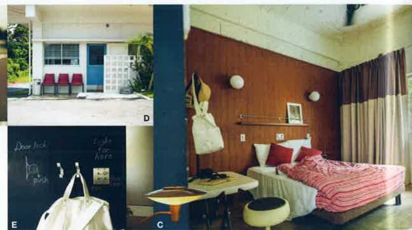
A 森に囲まれた心地よい環境。B 2Fのテラスは眺望が最高。バスタブのある屋上は貸切できる。C 2Fのダブルルーム。D カフェを兼ねたフロントの入り口。E おしゃれな友達の家のような内装。F 8時から11時はサターアングギーとオレンジジュース、コーヒーが無料。G ソフトドリンクのほか(オリオンビール) (¥400) なども用意。

中部・北中城村 SPICE MOTEL OKINAWA スパイスモーターホテルオキナワ 山腹のモーターで日常からの逃避行