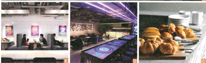
A 4樓廚房區提供各款最新式的家電、料理用具，還有24小時免費使用的咖啡機。E The Millennials研發的全新型態住宿形式，部份雙人床的空間中設有80吋螢幕，鬧鐘連與電動床相連結，不再用聲響，而是啟動電動床叫人起床。C 早餐提供多樣的現烤麵包。D 4樓的Lounge融入了澀谷的前衛風格，座位都設有插座，可充電、辦公。E 3樓設有工作空間，24小時都能使用，今年7月又在福岡開設了3號店，人氣可見一斑。

專為新世代設計的未來型旅店，繼京都後2018年又來到最新潮流匯集的澀谷開設了2號店。從日本膠囊旅館研發而來的獨創「Smart Pod」床型，部份雙人床的床位空間內設置了80吋投影螢幕、大型收納櫃，是全新的住宿型態。同時，把公共空間擴大，共佔旅店全體的20%，融入澀谷不斷變化、匯集多樣文化的概念，以前衛街頭藝術風裝飾。每天傍晚還會舉辦免費啤酒時間，讓旅客輕鬆交流。