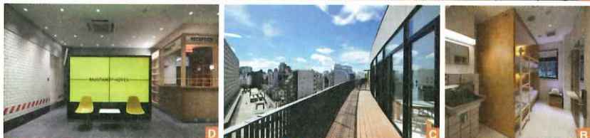
A 白色為基調的個人房能享受不受打擾的住宿時光。B 多人共同床型設計簡約時尚，以機能性為主打造聰明空間。C 從旅宿露台能一覽澀谷不一樣的清幽街區景致。D 以芥末黃為主要色調，白色的磚牆與紅色點綴，展現出活潑的美式風情。E 1樓為時尚的咖啡餐館「Megan」，提供多樣的餐點、甜品。