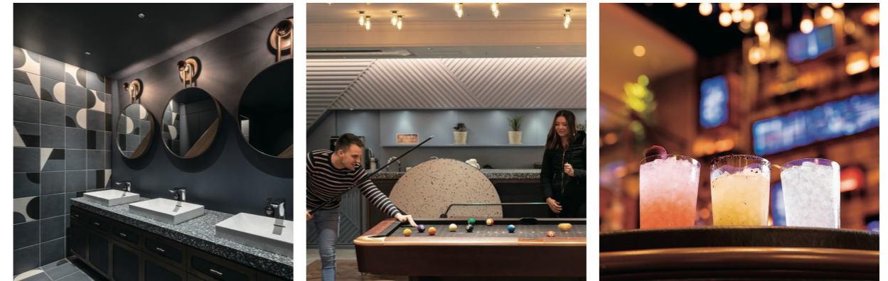
@themillennials.fukuoka #ザミレニアズ福岡 #themillennialsfukuoka #ステイケーション #capsulehotel #smartpod