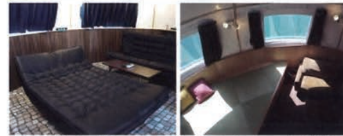
直径6.4mの船の中は2階建てになっており、トイレやバス、シャワーなどを備える。宿泊の定員は3人で、料金は1艇につき5万~10万円を予定する

ハウステンポスが新たに手がける、ARを活用して恐竜と戦える施設「ジュラシックアイランド」に、宿泊しながら移動できる水上ホテル。「泊まれる球形の船は世界初」(同社)といい、当初は2艇のみの展開だが話題性は抜群。アトラクション施設のオープンに合わせて、8月までには開業する予定だ。