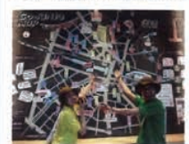
①4階の「OMOベース」には地元の人がある情報を詰め込んだ地図を掲示し、観光のアシストを図る