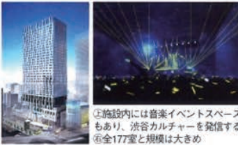
①施設内には音楽イベントスペースもあり、渋谷カルチャーを発信する②全177室と規模は大きめ

9月、渋谷にオープンする大型複合施設「渋谷ストリーム」(左写真)の9~13階に開業。4階には宿泊客以外も入れるロビーラウンジを設け、人の交流のハブとする。同施設には19年にグーグル本社の移転も発表されており、ビジネスパーソンからの需要も期待される。