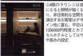
①4階のラウンジは夜になると照明が暗くなり、非日常的な空間を演出する②客室はデザイン性に重む。平日は1泊6000円程度とカプセルホテルとしてはやや高めの設定