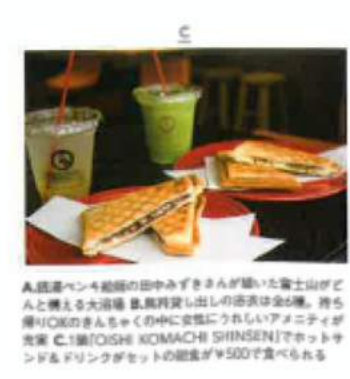
A:広さ4畳の個室の田やみずきさんが描いた富士山とAと構える大浴場 B:無料貸出しの浴衣は全6種。持ち帰りOKのきんちゃく(巾着)にうれしいアメニティが充実 C:1層「TOSHI KOMACHI SHINSEN」でホットサンド＆ドリンクセットの朝食が¥500で食べられる