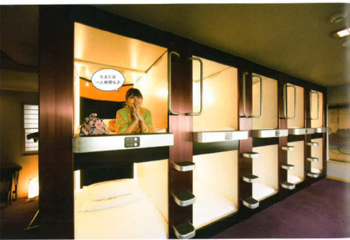
個室は外の光が差し込む12人用のカプセルルームと、6人用のカプセルが並ぶ個室タイプがある。運営が大手通信会社のUSJNのため、タブレットで音楽を流せるOTORAKUも設置