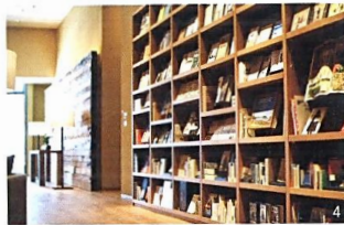
1. 石や木など多種多様な素材で形づくられたフロント。2. 全 5 種のうち、いちばん広いタイプの客室 (2,500 元～)。シンプルながら上質な空間になっている。3. 無印良品のタオルなどがセットされた洗面所。4. 古今東西、長く読み継がれた「ずっ」とい言葉*が詰まった本、約 650 冊を所蔵するライブラリ。宿泊者は無料で閲覧できる。