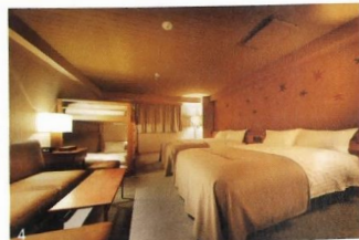
1. (ベストメイド)の弁や陶器などクラフト感満載のインテリアが占めるロビーの一角。2. 薪とコンクリによってしつらえたフロント。3. 札幌では希少なルーフトップバーでは、焚き火台を囲んで飲んで語らう。ローカルを対象とイベントも開催。4. 1～6 名まで宿泊できるファミリースイートタイプの部屋 (¥16,000～)。