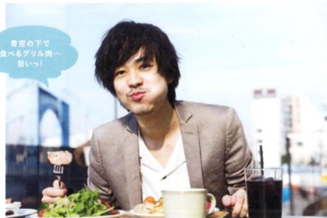
音楽の下で食べるグリル肉…おいっ!