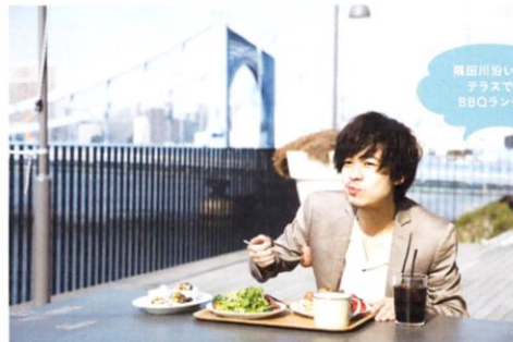
清瀬川沿いのテラスで BBQランチ